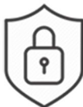
Vállalat- és Infomációbiztonság