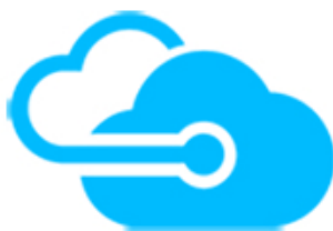
Migrációs projektek és Modern Munkakörnyezet